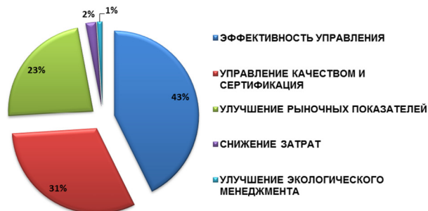
Распределение проектов по целям

Цели, которые достигаются в проектах на корпоративном уровне, включают: повышение эффективности управления, внедрение систем управления качеством и сертификации, улучшение рыночных показателей и снижение затрат.