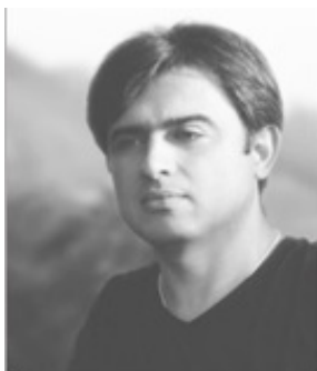
Генеральный директор АЙДЕЛИНК